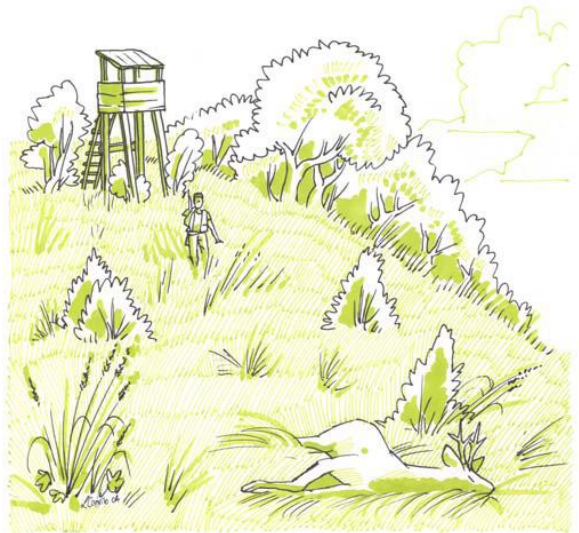
Disegno di L.Convito

Gli indici di ferimento vanno sempre coperti con fronde.