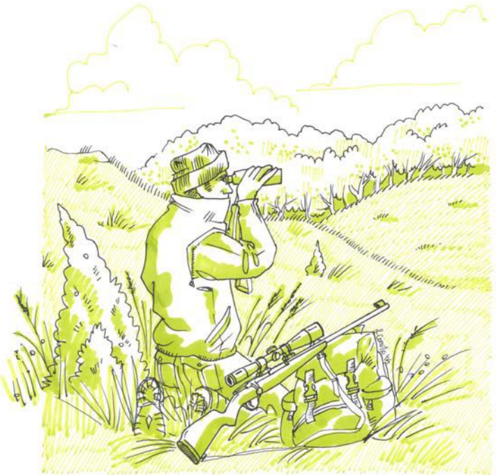
Disegno di L.Convito